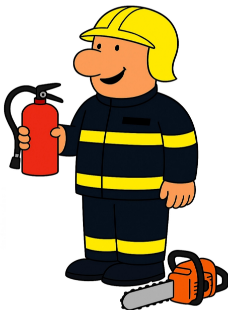
K5 Požární ochrana