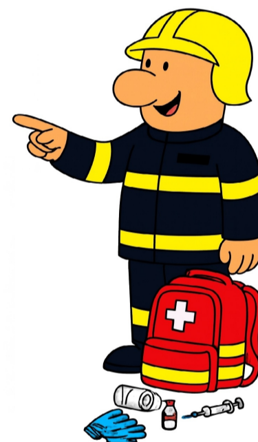
K6 Základy první pomoci