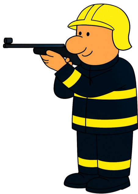
K1 Hod na cíl / střelba ze vzduchovky