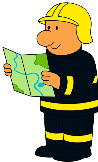
K2 Orientace v přírodě