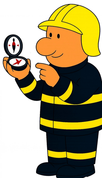
K8 Orientace v terénu